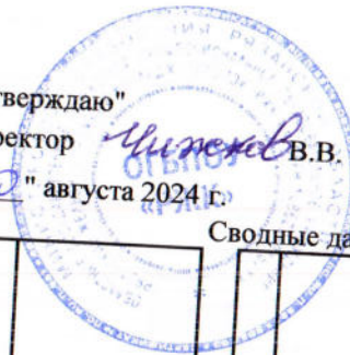
Сводные данные по бюджету времени